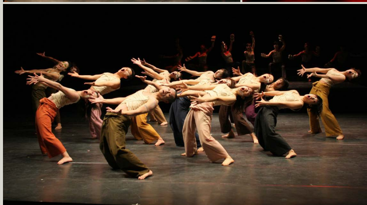
2007年青山円形劇場公演より

12月21日(木) 19:00 22日(金) 15:00 / 18:00 開場・受付 各30分前