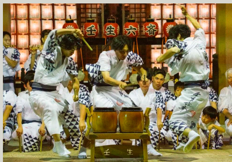
京都・壬生六斎念仏より