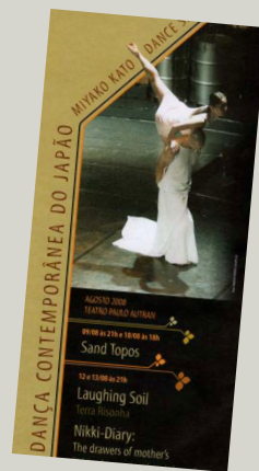
2008年ブラジル公演より