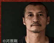
アオキ裕キ 新人Hソケリッサ!